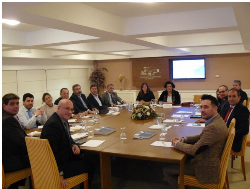
Instantáneas tomadas durante la Comisión de PRL de CEA