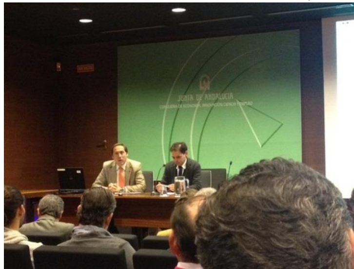
Inauguración de la Jornada “Riesgos biológicos en el ámbito laboral”. A la derecha de la imagen, el Director de Seguridad y Salud Laboral de la Junta de Andalucía.