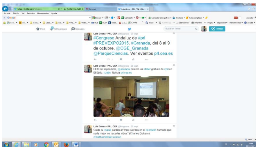
Instantánea de algunas de las noticias publicadas en la cuenta twitter del Gabinete de PRL de CEA

“Desde esta comunicación mensual trasladamos nuestra más sincera enhorabuena a todas las empresas premiadas o distinguidas en materia de prevención en este periodo, un ejemplo del compromiso y de la implicación empresarial con la seguridad y la salud en el trabajo ”.