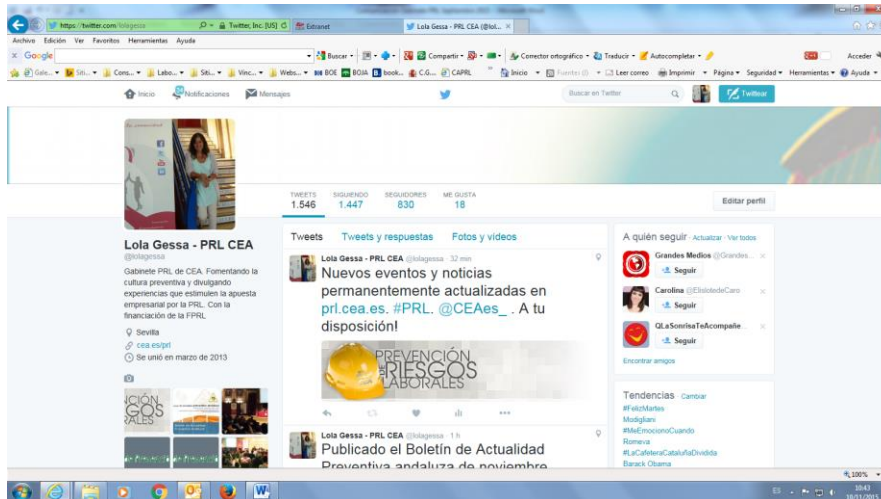
Imagen principal de la cuenta twitter del Gabinete de PRL de CEA (@lolagessa)

Desde su creación, nuestra cuenta twitter ha lanzado 1.546 tweets acompañados de diferentes links de referencia, imágenes y videos.