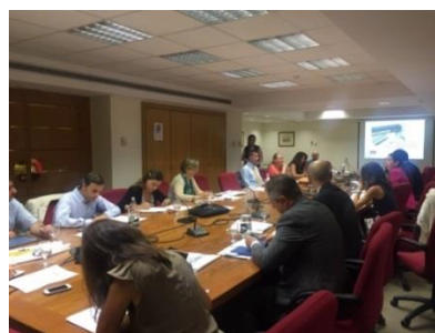
Participantes en la jornada organizada por CEOE