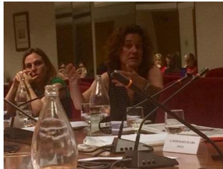
Momento de la ponencia de la Directora de PRL de CNC