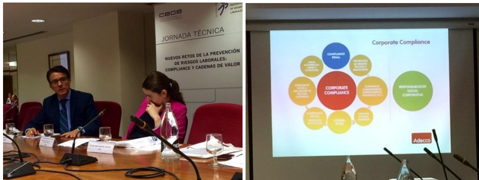
Instantáneas tomadas durante la intervención del Director Jurídico y de Prevención de Grupo Adecco