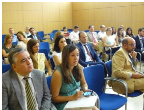
Imágenes tomadas a lo largo de la jornada