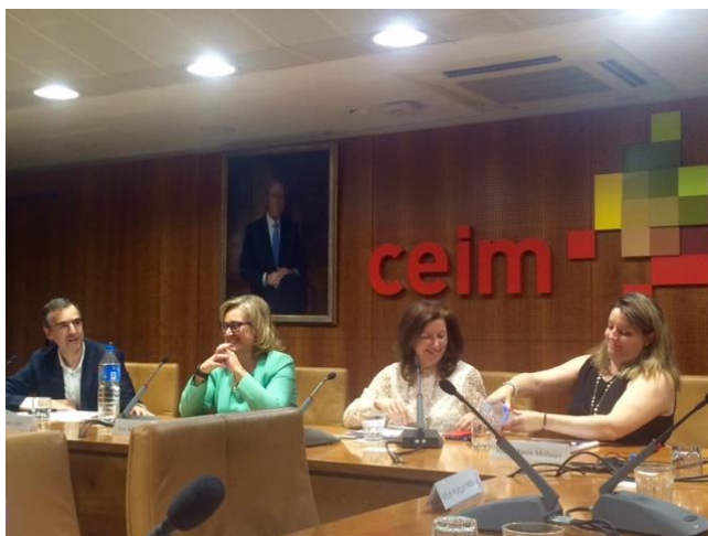
Imagen tomada durante el acto de clausura

Durante la misma se puso de manifiesto la importancia de la celebración de estos encuentros que se organizan desde hace más de una década por las diferentes organizaciones empresariales territoriales, y que cuentan con el inestimable apoyo y financiación de la Fundación para la Prevención de Riesgos Laborales.