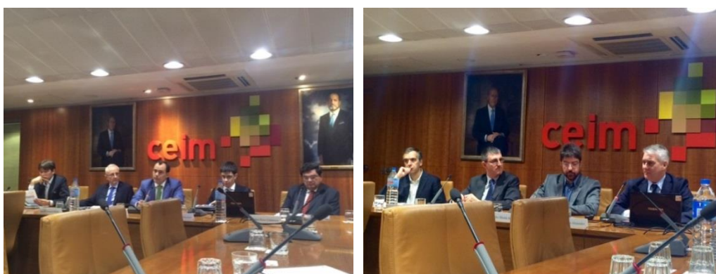
Instantáneas tomadas durante las sesiones del Fórum

Destacar que desde PrevenControl se señalaron los beneficios de la gamificación para la formación en prevención de riesgos laborales y que se mostró la app “apprevenirt”.