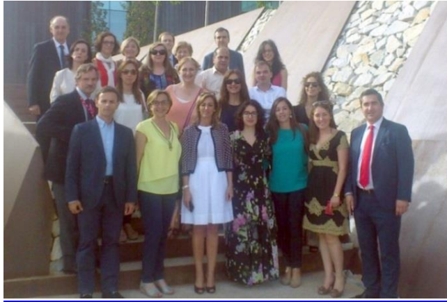
Instantánea de la visita realizada a la Ciudad del Banco Santander

de la mano de sus responsables de prevención, el eficiente sistema de gestión de la preventiva de la entidad, su modelo de promoción de la salud y las excelentes instalaciones y medios con los que cuentan para tales fines.