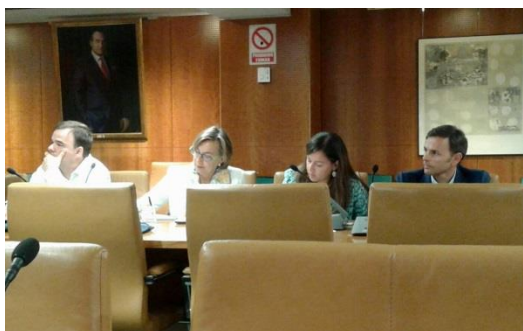
Participantes en el Fórum, entre ellos la Responsable del Gabinete PRL de CEA

En la sesión realizada el 9 de junio intervinieron representantes de Uría Menéndez Abogados, Fremap, Umivale o la Dirección General de Tráfico, que intentaron avanzar en una posible homogeneización de criterios entre los aspectos tratados.