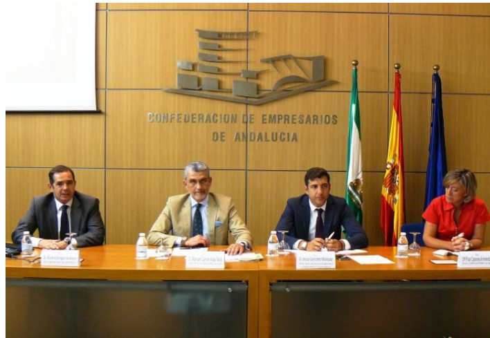
Instantánea de la inauguración de la jornada “Empresa segura, empresa saludable”. En el centro, el Director del Área Jurídica y Relaciones Laborales de CEA y el Director General de Seguridad y Salud Laboral

En cuanto a los temas de las ponencias, éstas han tratado sobre la autogestión de la prevención de riesgos laborales en la empresa, cómo pasar de la empresa segura a la saludable y el trabajo saludable en cada edad.