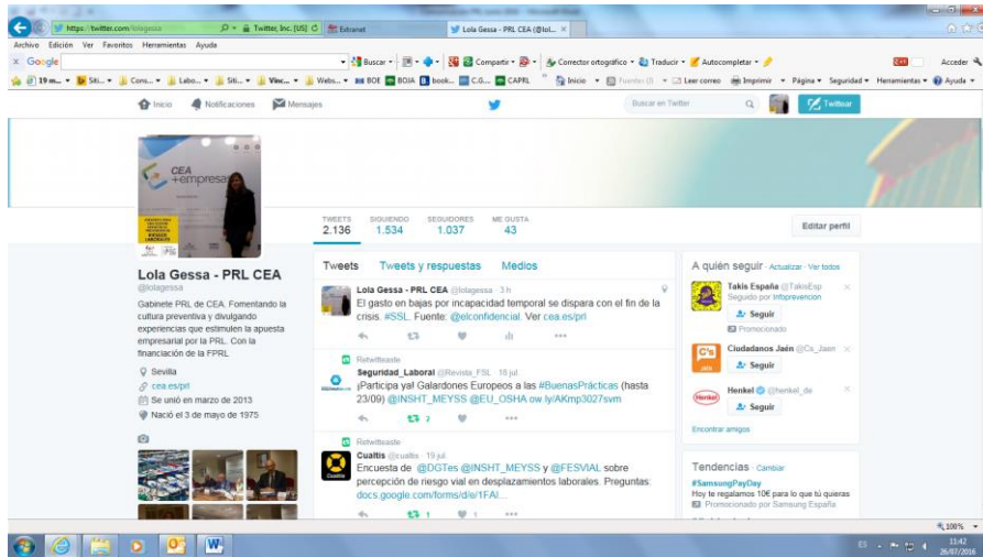
Imagen de portada de la cuenta twitter del Gabinete de PRL