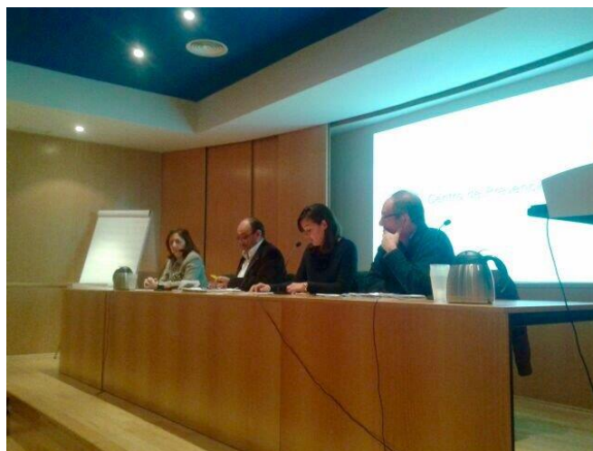
Imagen tomada durante la jornada de Seguridad Vial

Tras la mesa redonda tuvo lugar una exposición sobre “La norma ISO 39001 como herramienta de gestión de la seguridad vial”, y una muestra de herramientas y aplicaciones prácticas para mejorar la sensibilización en esta materia, contando con la participación de Aenor, Ibermutuamur y Amaya.