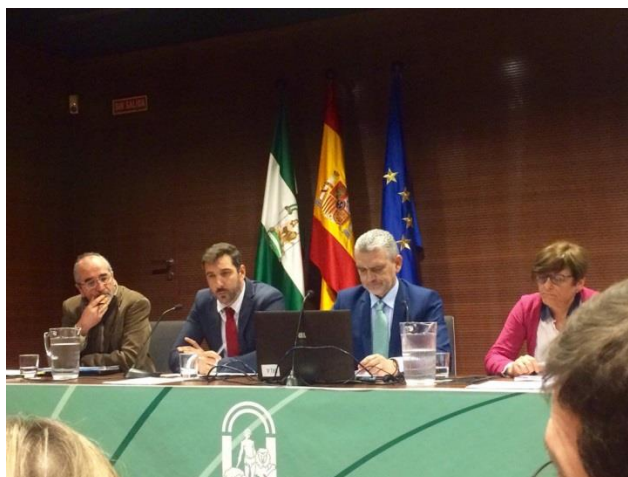
Imagen tomada durante la exposición del Director de Relaciones Laborales y Seguridad y Salud Laboral de la Junta de Andalucía

Respecto a la Estrategia Andaluza de Seguridad y Salud en el Trabajo 2017/2022, señaló que "queremos culminarla de manera inmediata".