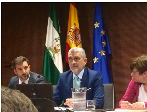
Intervención del Director del Área Jurídica y Relaciones Laborales de CEA

Finalmente invitó a visualizar en la página web de CEA, www.cea.es , el trabajo que la Organización Empresarial ha venido desarrollando para divulgar su compromiso empresarial con la prevención: “un espacio que denominamos COMPÁRTELO, en el que se exponen distintas experiencias de empresas sobre el concepto de la prevención de riesgos en el trabajo, y la seguridad y salud laboral. En definitiva, un claro ejemplo de la concepción de la cultura empresarial preventiva”.